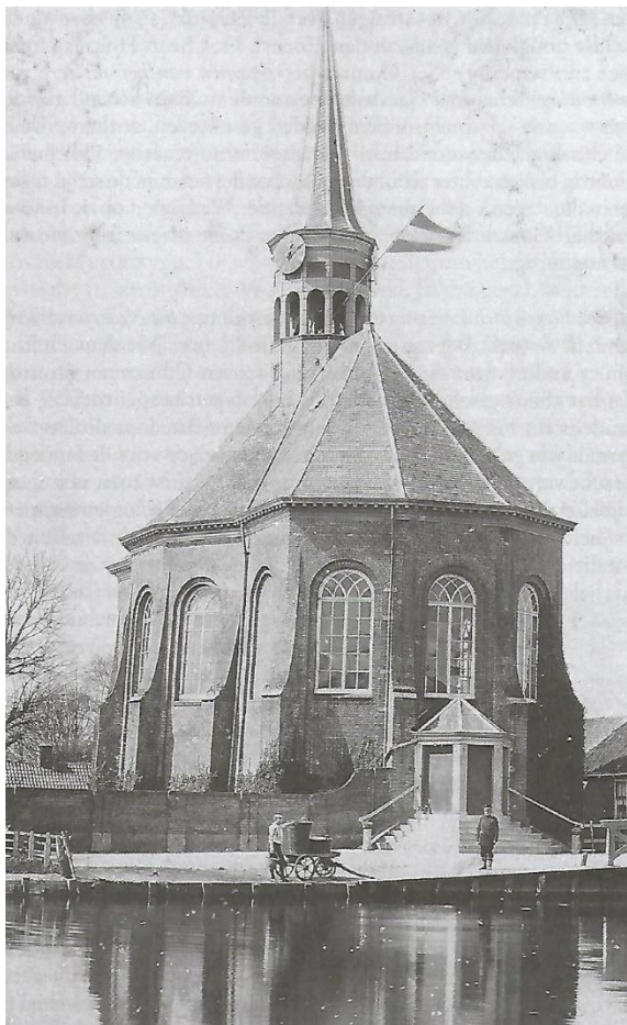
De kerk ergens rond 1800

Voor elke dag een beetje kerk in de Coronatijd.